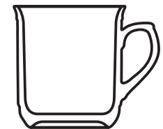
Bayern Kaffeehaferl, weiss