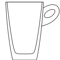
Café au Lait Becher

The printed surfaces shown are average sizes. Since the structure of the decoration determines the maximum printed surface, it can only be specified after examination of the decoration.